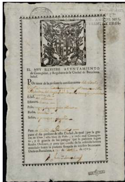
Figura 4. Patent de sanitat lliurada l'any 1723 per l'Ajuntament de Barcelona a Salvador Pujol (AHCB, 1-002/CCAM, 12/1L.XI Patents de Sanitat, 27, C-15)

La observansa tenim en est port es que aportant patents y bolletas de sanitat de las ciutats de Màlaga, Cartagena y